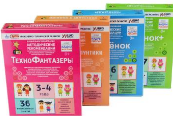
Интерактивное пособие инженерно-технической направленности "ИКаРёнок"